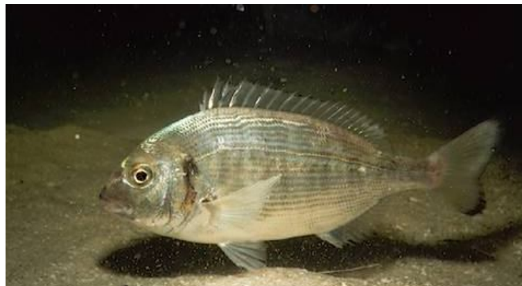
(c'était la Daurade, avant)

Avec un p'tit blanc et des petits légumes, c'est super