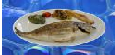
(la Daurade, après)